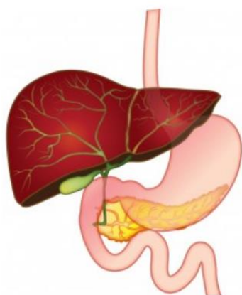
Alveesklier, lever en galwegen

De alveesklier produceert alveeskliersap dat helpt bij de spijsvertering en hormonen die de bloedsuiker reguleren (insuline).